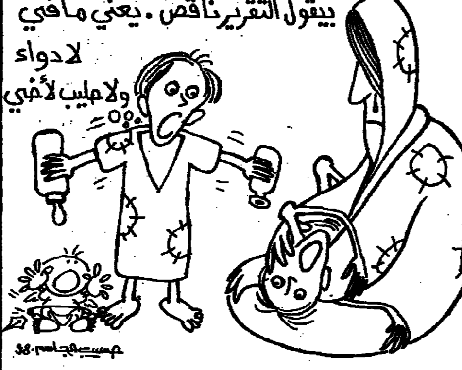
يقول التقرير ناقص . يعني ما في لادواء ولا حليب لأخي